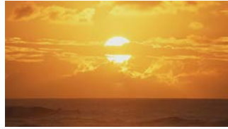
サンセット・ビーチ