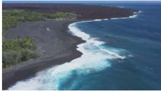
アイザック・ヘイル・ビーチパーク