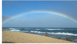
ホオキバ・ビーチパーク